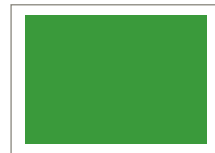
1/2 Seite hoch