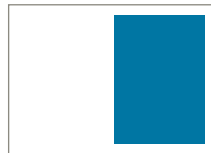
1/2 Seite hoch